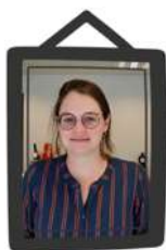
Fedra Tolpe Secretariaat