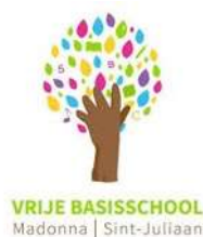
VBS Madonna Sint-Juliaan

Onze school vormt samen met een aantal andere vrije basisscholen uit Langemark-Poelkapelle en Zonnebeke scholengemeenschap 'De Kollebloeme':